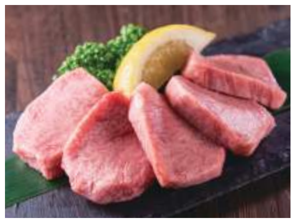
特タン芯 2,980円 (税込3,278円) 当店伝統の皮付きの生タンだからできる希少タン元部位です。生タンの色、つや、柔らかさをご確認ください。