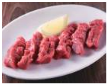
タンすじ 780円 (税込858円) 塩 or 味噌ダレ 深い味わいですので通の方は好んでご注文されるタン部位です。