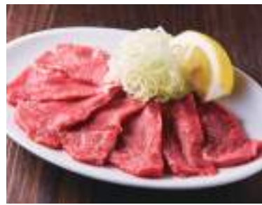
タンさき塩 ネギ添え 980円 (税込1,078円) 歯ごたえと食感が人気のタンさき塩です。ネギと一緒にどうぞ。