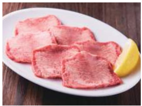
上タン塩 1,880円 (税込2,068円) 生タン独特の風味と柔らかい歯ごたえが自慢の絶対商品です。