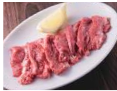
タン下 780円 (税込858円) 塩 or 味噌ダレ 上タンや特タン芯の下に位置する牛タン部位です。味噌ダレとの相性が抜群です。